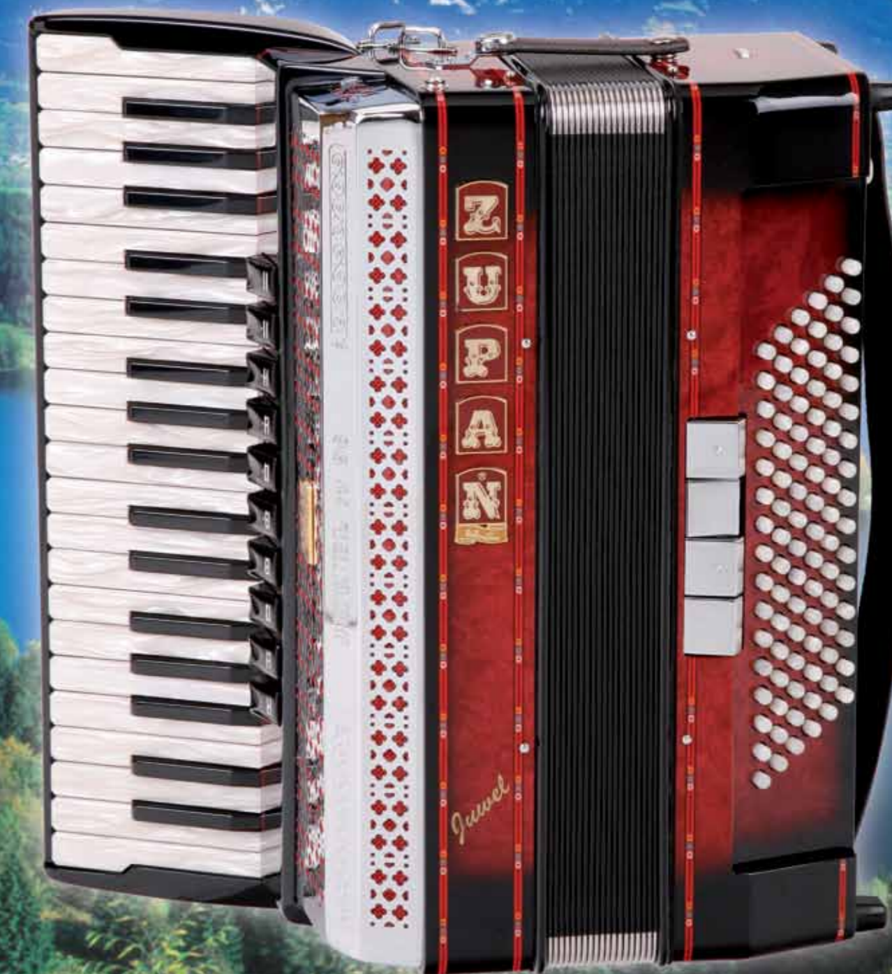
Juwel IV 96/M